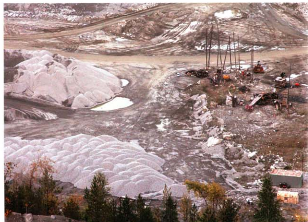
Карьер ordinarily щебенки, который я обнаружила во время поисков подходящих пней для своей работы