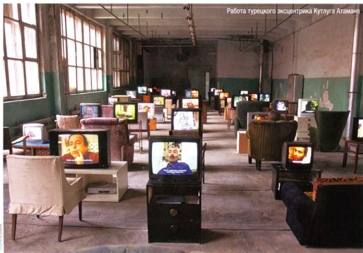
Работа турецкого эксцентрика Кутлуга Атамана