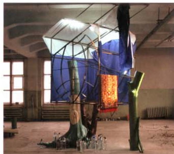
Моя «Синкретическая избушка», созданная за 8 дней в Екатеринбурге. В бутылках — вода, заряженная экстрасенсами, за счет энергии которой «избушка» и освещается

Поэтому когда WAR узнала, что она едет на II Уральскую и индустриальную биеннале современного искусства, поручить фототчет об открытии важного форума.