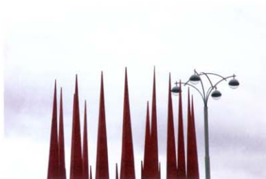
Из знаменитого памятника конструктивизма «Дом физкультуры» 1929 года постройки открывается вид на эти странные красные пики